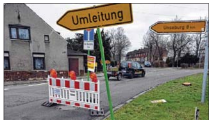
In Altenweddingen werden die Autofahrer wegen der gesperrten Bundesstraße 246a in Richtung Borne und Wolmirsteden umgelenkt.

Während die Reparatur des maroden Straßendurchlasses, der sich auf dem gesperrten Teilstück der B 246a befindet, am 14. März beginnen soll, wird der vierte Abschnitt des Ausbaus der Ortsdurchfahrt Altenweddingen vorbereitet. Er soll am 29. Februar beginnen und voraussichtlich am 30. August beendet werden. Der Ausbau ist eine Gemeinschaftsaufgabe zwischen der Gemeinde Sülzetal, dem Trink- und Abwasserverband Börde Oschersleben und der Landesstraßenbaubehörde.