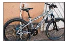
Der Rahmen dieses Rades ist beklebt. Teilweise sind blaue Sprüpflecke vorhanden. Es hat eine bunte Hupe.