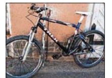
Bei diesem vollgefedertem Mountainbike der Marke Trek, Vollgefedert wurde die Rahmennummer neu gestanzt.