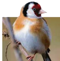
Der Stieglitz ist der Vogel des Jahres 2016.

Die Stunde der Gartenvögel liefert für den Naturschutz Infos zu Entwicklungen der heimischen Vogelwelt und Grundlagen, um zielgerichtet aktiv zu werden. Zum Beispiel zeigen die Zahlen der vergan-