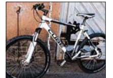
Die Polizei sucht den Besitzer dieses Fahrrades „Cube Attention“. Hier wurde die Rahmennummer abgeschliffen.

Hinweise nimmt die Polizei unter der Telefonnummer 03904/47 80 entgegen.